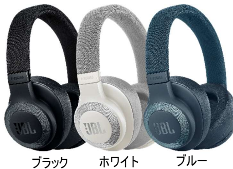
ブラック ホワイト ブルー