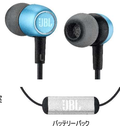
バッテリーパック

人気の E25BT をベースにししながら、ハウジング、リモコン、バッテリーパックの素材に軽量かつ剛性に優れたアルミを採用することで、耐久性と高級感のある落ち着いたデザインを実現しました。ブラック・シルバー・ブルーのカラーラインアップにより、使用シーン問わずファッションに取り入れやすいモデルです。